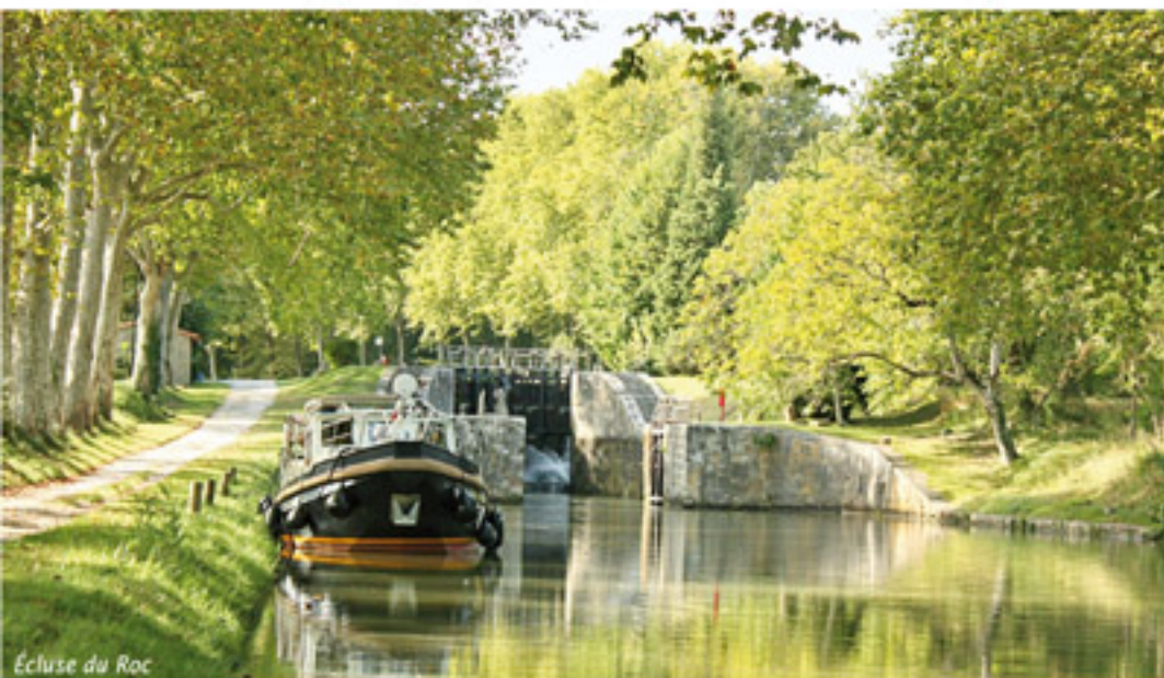
Écluse du Roc

4 grandes cartes : pistes cyclables, histoires, ouvrages, photos 4 large maps : cycle lanes, stories, construction works, pictures